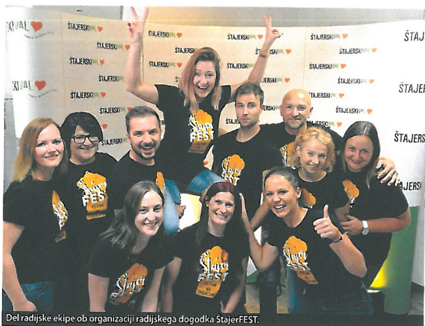
Del radijske ekipe ob organizaciji radijskega dogodka ŠtajerFEST.